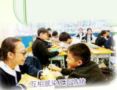
互相感染正面情緒