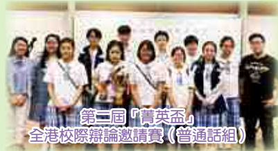
第二屆「菁英盃」 全港校際辯論邀請賽（普通話組）

很多人認為，辯論是口舌之爭，只要有伶牙俐齒就能戰無不勝。但事實並非如此。辯論比賽是一門需要擁有緊密邏輯、嚴謹分析、高階思維的學術活動。過程中，學生需要對辯論的題目蒐集本地及外國資料，當中還需要涉獵不同的語言，例如英語和德語等等。學生也需要在有限時間內蒐集與辯題有關的文獻，加以分析，並且進行聆聽及歸納對手發言，並作出有效的反駁才能得分，絕不是一門只講求口才的活動。因此辯論隊同學在歷年參與了不少的比賽，提升水平。