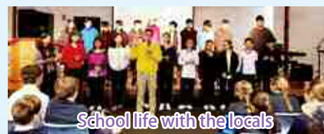
School life with the locals