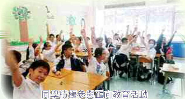
同學積極參與正向教育活動