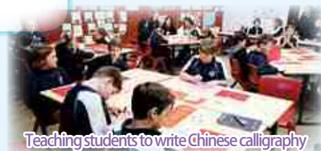
Teaching students to write Chinese calligraphy

The most unforgettable experience was visiting the zoo. It was my first encounter with Aussie animals like koalas, crocodiles and kangaroos. I really enjoyed the trip because not only could I learn English but also build friendships with some local Australians.