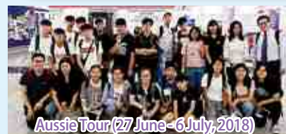
Aussie Tour (27 June - 6 July, 2018)