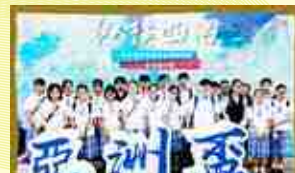
第四屆亞洲盃中學華語辯論錦標賽

很多人認為，辯論是口舌之爭，只要有伶牙俐齒就能戰無不勝。但事實並非如此。辯論比賽是一門需要擁有緊密邏輯、嚴謹分析、高階思維的學術活動。過程中，學生需要對辯論的題目蒐集本地及外國資料，當中還需要涉獵不同的語言，例如英語和德語等等。學生也需要在有限時間內蒐集與辯題有關的文獻，加以分析，並且進行聆聽及歸納對手發言，並作出有效的反駁才能得分，絕不是一門只講求口才的活動。因此辯論隊同學在歷年參與了不少的比賽，提升水平。