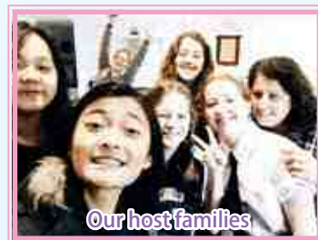
Our host families