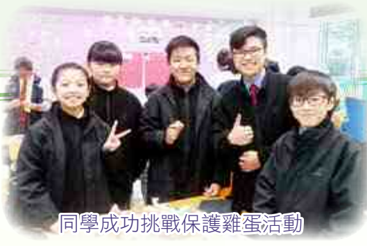
同學成功挑戰保護雞蛋活動