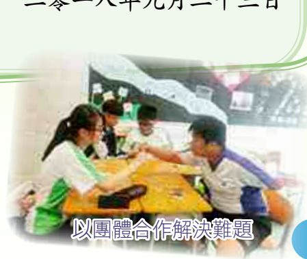
以團體合作解決難題