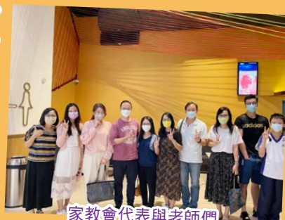
家教會代表與老師們