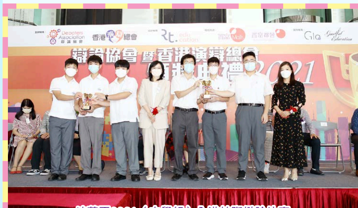
培菁盃2021 (中學組) 全港校際辯論比賽