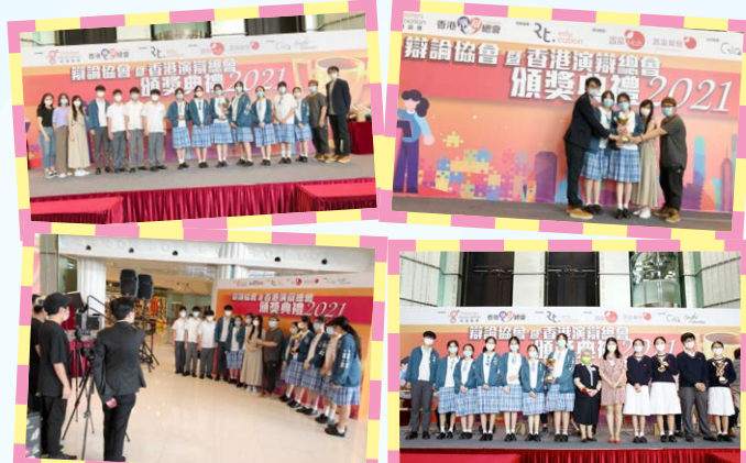
學思盃2021 (中學組) 全港校際辯論比賽