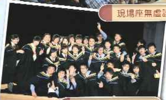
畢業了！大家興奮地在台上來個大合照。