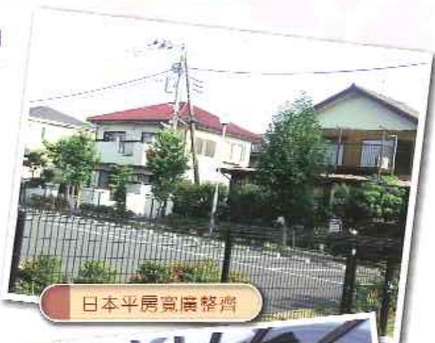
日本平房寬廣整齊

日本人十分好客。他們能對素未謀面的我們熱情招待。例如在教會的兄弟姊妹。他們在我們第一到埗的晚上，替我們弄了一頓豐富的晚餐，還不停地問我們合不合胃口，並常常替我們添菜。另外，還有民宿的主人，他們對我們完全不認識，卻讓我們在他們家居住兩天，並貼心地照顧我們。還記得第一天跟他們吃飯時，被民宿主人留意到我們喜歡吃布丁。在翌日早餐時，我們便有布丁作早餐甜點。我們從黃老師口中得知，是民宿主人早一天晚上特地買的，這份細心令我十分難忘。