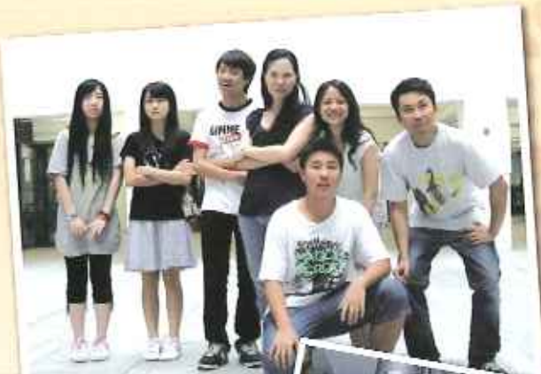
師生旅程中不少不免合照留念