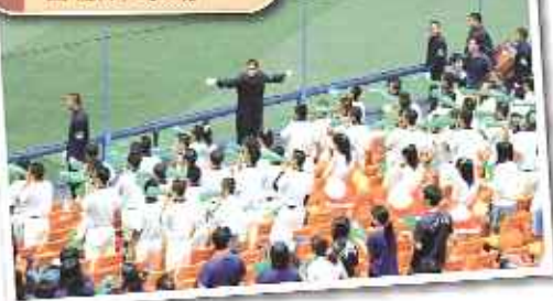
應援隊的喊聲音 響徹棒球場

旅日行程中，有一天是要去觀看棒球賽。那天的天氣熱得令人叫苦連天，但半邊球場竟然都是座無虛席，更令人咋舌的是雙方的啦啦隊。他們的吶喊聲、歌唱聲響徹整個球場！我可以在球場的另一邊清晰地聽見彼方啦啦隊高喊「加油！加油！」據小野寺先生說，倘若喊聲不夠大的話，應援團（即是他們的啦啦隊長）會被抓出來痛罵一番。應援團打氣聲不夠鄰校大的話，亦會被人視為笑柄，所以為了維護自己學校的尊嚴，學生一般都會聲嘶力竭地為球隊打氣，他們的團結性及對學校的歸屬感，我認為很值得香港的學校學習。