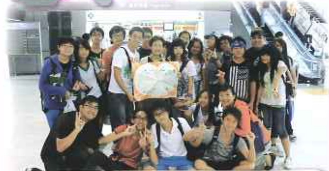
2010「日本遊」是一次令人難忘的旅程！