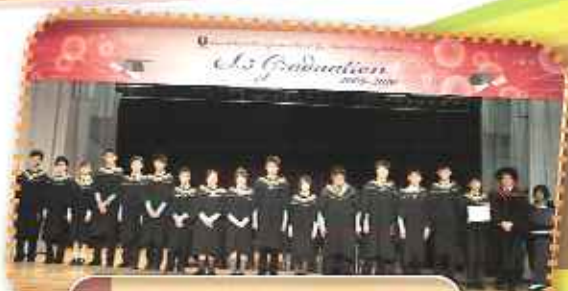
畢業生是學校初熟的果子

過去一年，除了第一屆學生參與中學會考外，學校另外一棵初熟的果子，便是接受教育局的校外評核。教育局有一批專業的队伍，每年會到不同的中小學，進行評核，了解學校在行政、教學、校風及學生各方面的表現。校外評核隊在耀道中學評核兩星期後，對學校各方面的表現，有極大的肯定，現節錄校風及學生兩方面，讓家長能有進一步的認識：