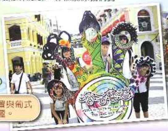
塔石藝墟裝置與葡式建築相映成趣。

同學都十分享受是次學校為同學安排的澳門遊。能夠讓同學欣賞澳門特色歷史建築之餘，亦能加深我們對澳門歷史的認知，實在獲益良多！