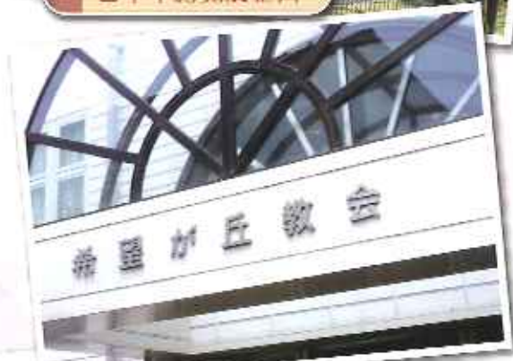
我們到達的第一站：希望之丘教會