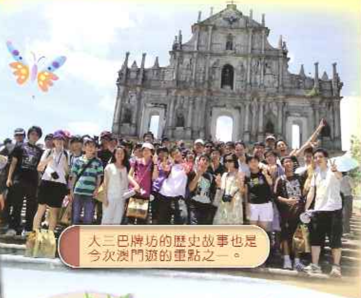
大三巴牌坊的歷史故事也是今次澳門遊的重點之一。