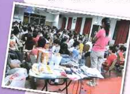
各畢業同學聚集一堂，靜心地聆聽活動的安排。