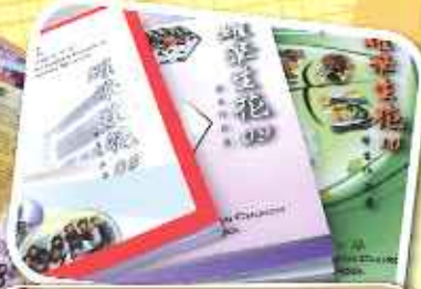
三年的《耀筆生花》正好印證繡道中學的成長！