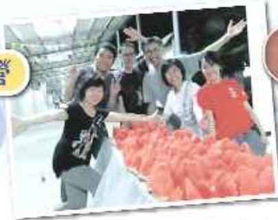
老師為同學們預備甜入心扉的西瓜。

而多個活動之中，相信大家最難忘的是「升學」這一項。在活動中，每組都會得到不同的「會考成績」，然後要以入大學為最終目標來自行決定升學途徑，並且要按其選擇而到不同的地方完成任務。此目的是幫助我們更了解自己的升學選擇，為會考放榜作好準備。活動完結後，大家都大汗淋漓，而且每一組都能完成挑戰，可見人家的投入程度相當高。