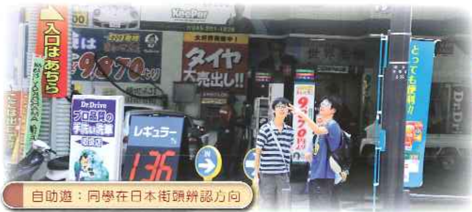
自助遊：同學在日本街頭辨認方向