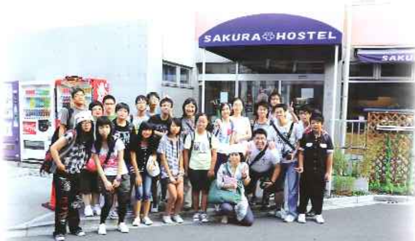
在櫻花旅館前留影

最後，我一定要感謝同行老師對我們無微不至的照顧，還有同學之間的互相幫忙，使整個旅程得已順利完成，我相信一切都會是我們窩心的回憶。