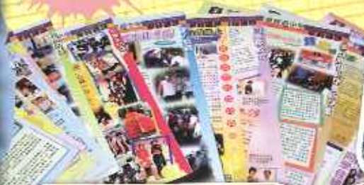
多年的《家校通訊》聚集在一起多壯觀！