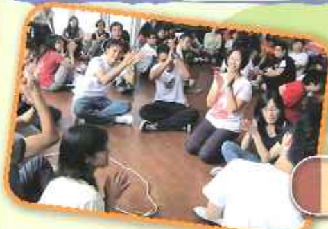
老師們在活動中互相支持和鼓勵

「學生儀容整潔，待人有禮，和善受教，愛護學校，對學校有歸屬感。他們尊敬師長，願意與人溝通。他們亦樂於擔任服務工作，具服務精神和責任感。朋輩間相處融洽，高年級同學樂於照顧低年級同學，能守望相助。」（報告第十二頁）