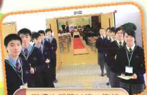
服務生嚴陣以待，迎接五周年校慶的來賓。