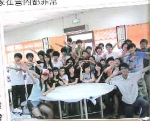
看！我們每個人都在發熱發亮！

其實人家在營內都非常珍惜彼此相處的時間。即使晚上已感相當疲倦，但仍不願入睡，因為大家心知在此一別後，難以再有機會與眾多的朋友相聚，所以希望把握相聚的每一分秒。可惜的是時間總會流逝，縱使大家有再多的不捨，三天兩夜的畢業營在大家拍完合照後，始終都要結束。但小記相信各位參與者都會把這些非筆墨所能形容的感覺及記憶永藏心底，不會遺忘的。