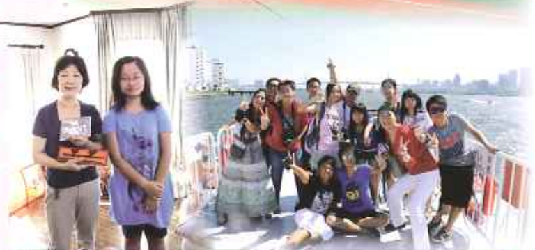
同學向民宿主人致送禮物