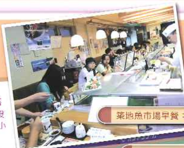
築地魚市場早餐：盛宴

難忘就是難以忘記。由上飛機去日本開始，到在香港國際機場落機完結整個旅程，每件事、每個片段、每段時間，都像魚一樣不斷地浮游在腦海中……。以下每段小節並沒有連接：